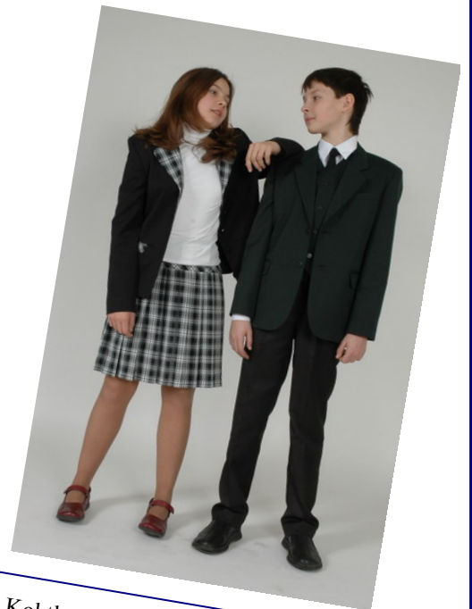
Kohtla Põhikooli poisi ja tüdruku koolivorm